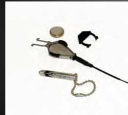
Balise autonome pour faucon

Les premiers matériels de repérage et suivi d'animaux datent des années 1960.