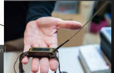
Balise pour grands rapaces